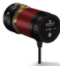
COMFORT 15-14 B PM