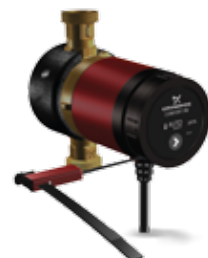
COMFORT 15-14 BXA PM