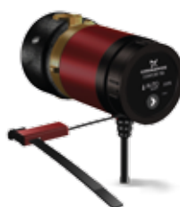
COMFORT 15-14 BA PM