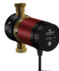
COMFORT 15-14 BX PM